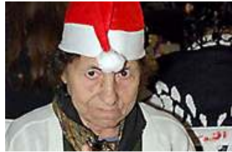
Accompagner les têtes blanches, rendre leur solitude plus douce sont une mission de Rifaq el-Darb.

Rifaq el-Darb, qui assure un repas chaud par mois dans ses locaux dans les vieux bâtiments de l'Université Saint-Joseph, met les têtes blanches en contact